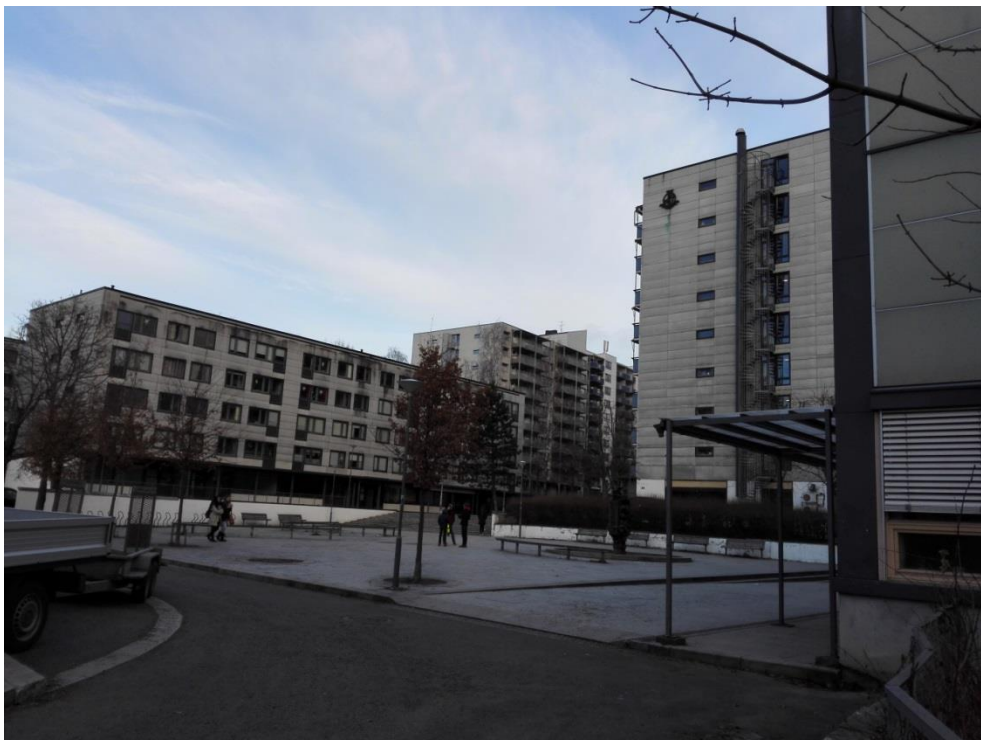
Bilde av Hovseter torg, med Hovseter skole til høyre, og blokker i Setra borettslag

Hovseter-beboere er stolte av nabolaget sitt, men Hovseter har et negativt omdømme i Oslo. Det er behov for å endre fortellingen om Hovseter i positiv retning.