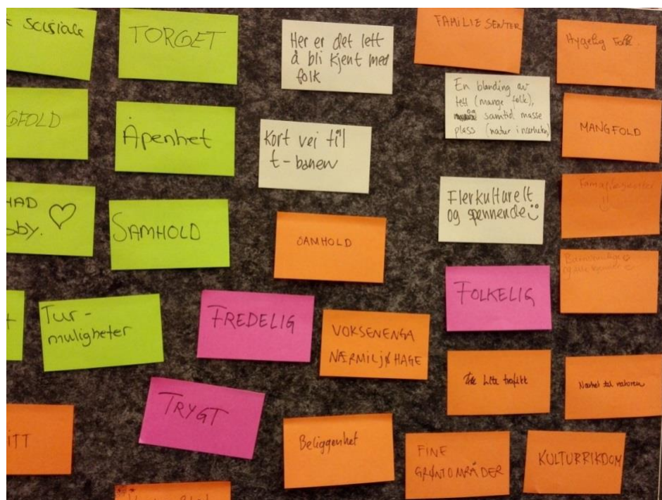
Bilde fra workshopen 18. januar 2018: «Hva er bra med å bo på Hovseter?»

NÆRHET TIL NATUREN og fine grøntområder i nærheten. Samtidig ligger Hovseter sentralt, med kort avstand til kollektivtilbud og Oslo sentrum.