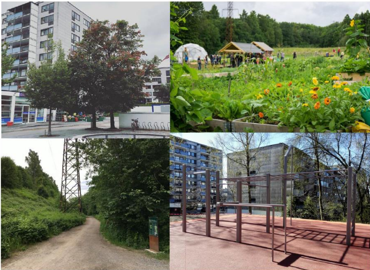
Mangfoldige Hovseter; Øverst f.v: Hovseter torg, Voksenenga nærmiljøhage, gangvei langs Mærradalsbekken og treningspark sentralt på Hovseter.

Det er få tilgjengelige lokaler til utleie for lag/foreninger eller barnebursdager i området. Dette er etterspurt av beboere.