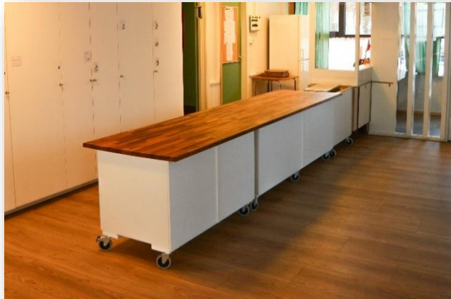
Serveringsdisker i 3 moduler.