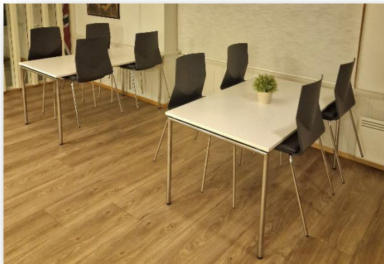
Øvre del av spisesal. rekker av 1x1 bord.