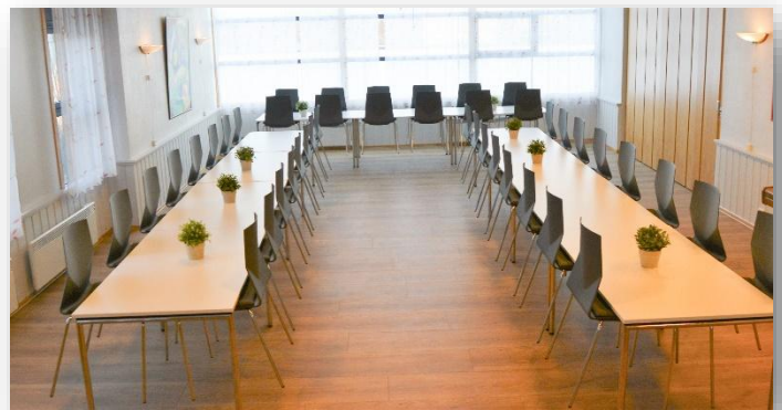
Nedre del av spisesal. Rekker av 2x4 bord og 1x3 bord.